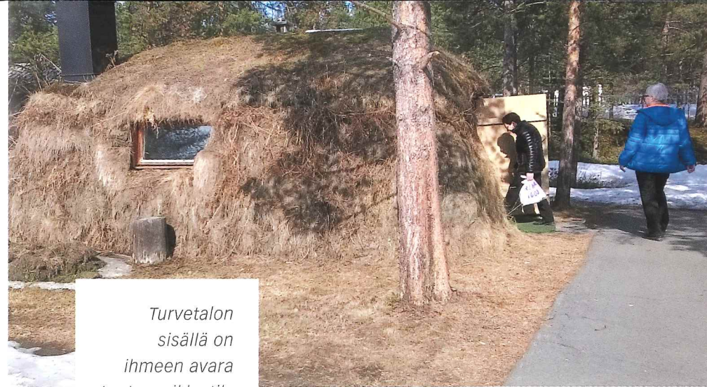
Turvetalon sisällä on ihmeen avara tuntu, vaikka tila ei ole suuri.

Karasjoella Norjassa keskustelumme keskittyi erityisesti saamelaisen kulttuurin erityispiirteiden tunnistamiseen ja oman identiteetin löytämiseen. Kaikki maat, joiden alueella saamelaiset elävät, ovat kettaneet yhtenäistää saamelaisia osaksi valtaväestöä jossain vaiheessa historiaa. Suomessa ensimmäiset lapset saivat saamenkielen opetusta koulussa vasta 1970-luvulla. Vielä 50-luvulla saamen kielten puhuminen koulussa oli kiellettyä. Vanhassa sukupolvessa on ihmisiä, joille saamelaisuus yhdistyy johonkin häpeälliseen.